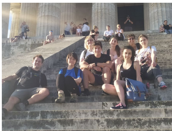
跟來自德國、法國、墨西哥、羅馬尼亞、義大利的朋友爬山後到