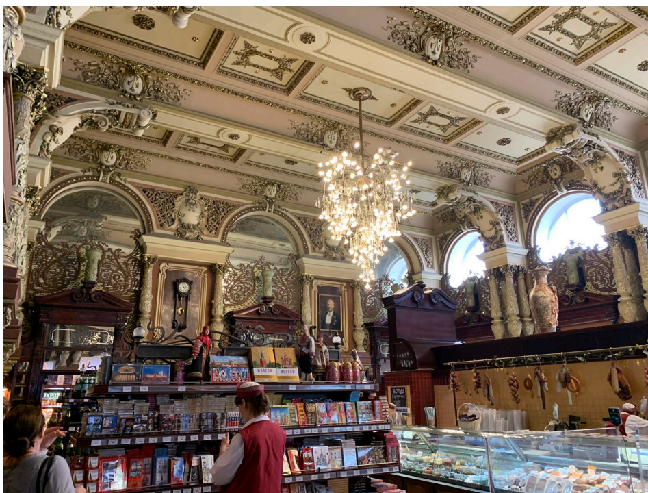
圖一 貴族超市-莫斯科

相片（2~3 張貼進 word 檔案，含說明，並 Email 原檔給國際處承辦人）