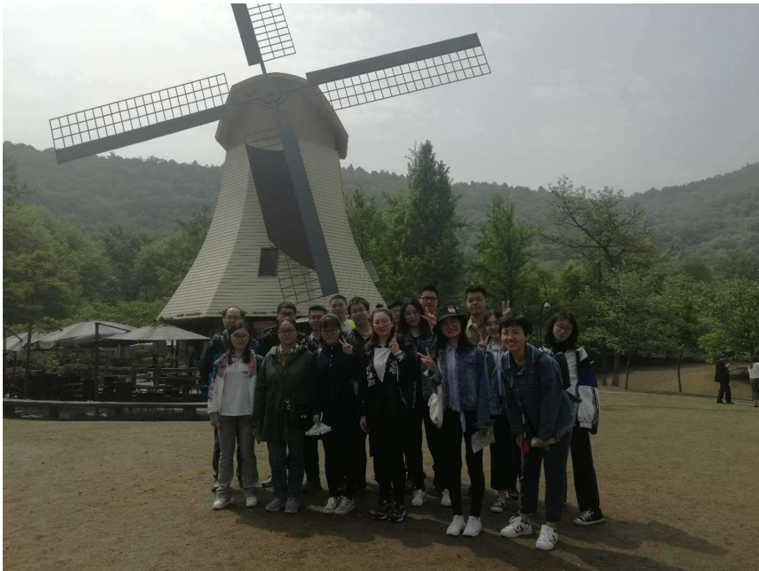
和班上同學一同遊覽西湖。