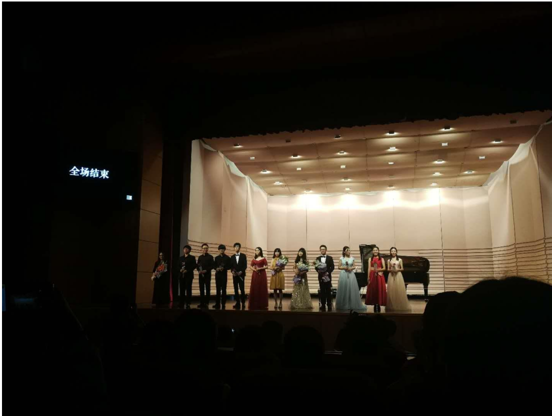
鋼琴社的成果發表（學校的演出大廳經常會有免費的音樂會）