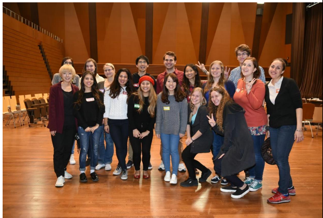
26-6-3 法政大學舉辦的兒童英文日，與不同國家學生一起參與志工