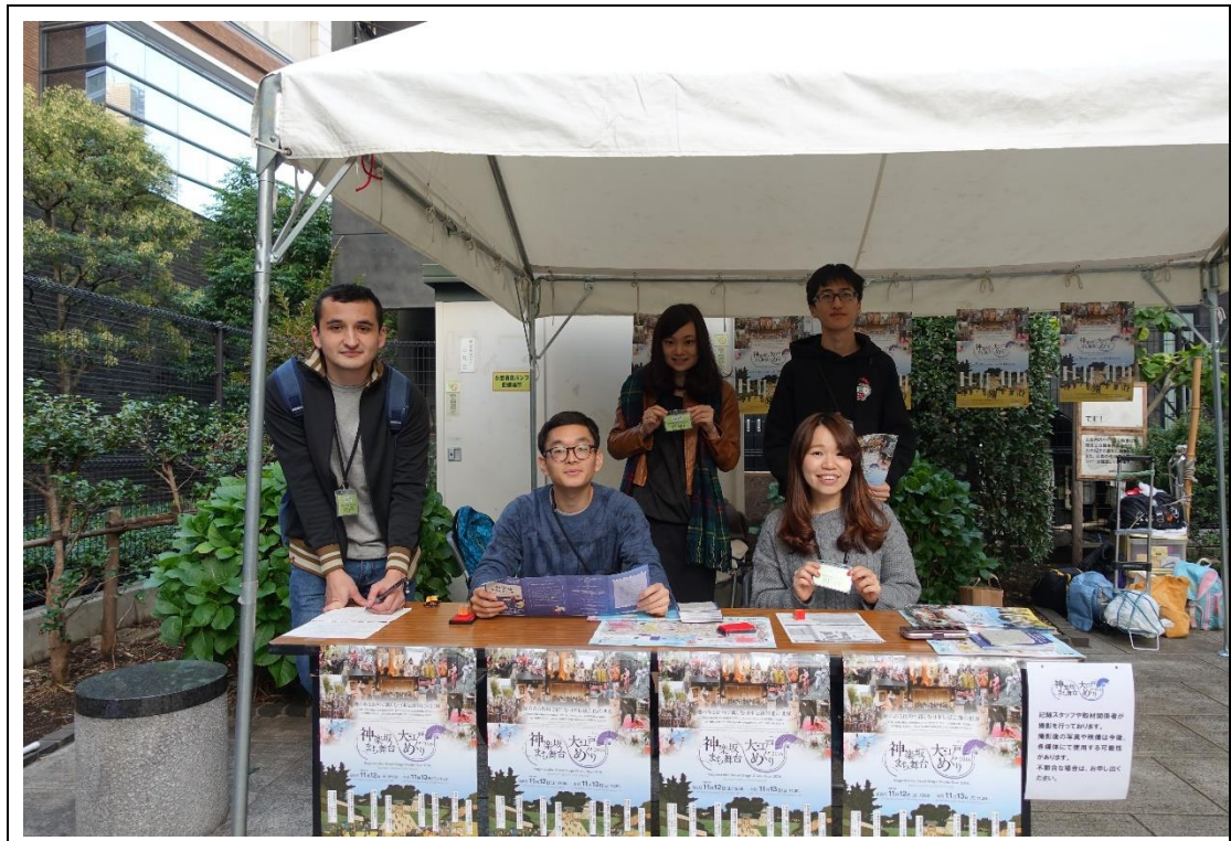
26-6-2 神樂坂祭典的採訪志工夥伴