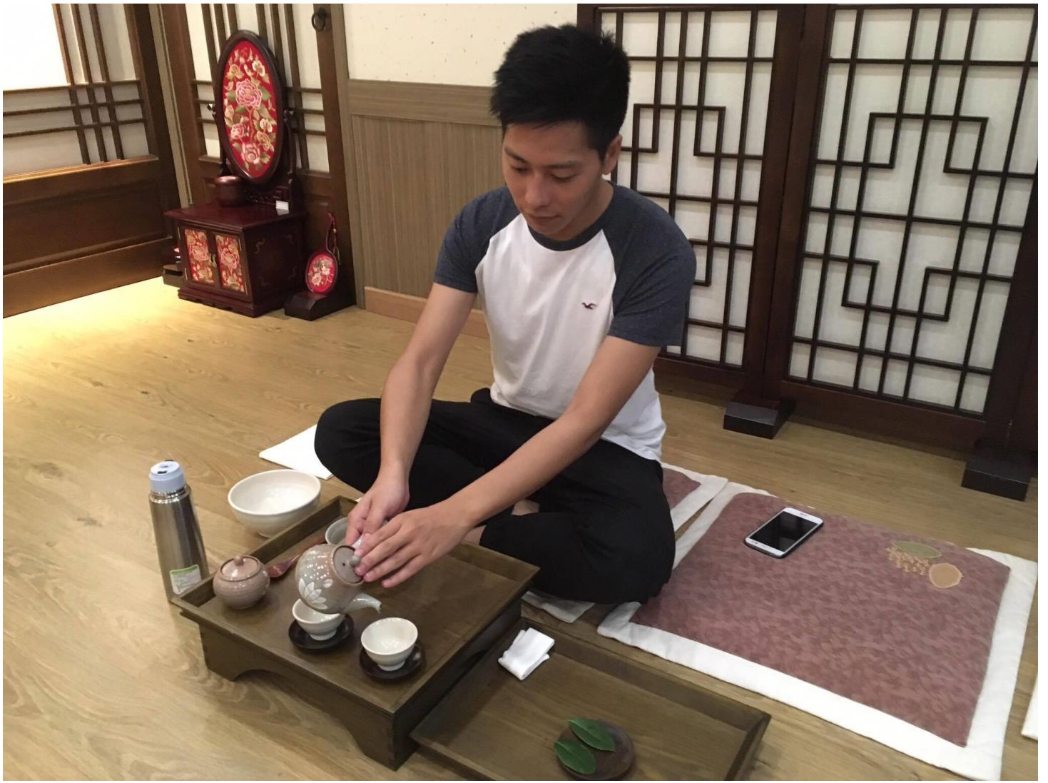
(釜山博物館，體驗韓國茶道)