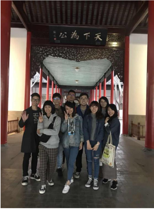
圖片背景為南京市一處文化遺址---總統府，為交換生與學伴共同出遊的合影。