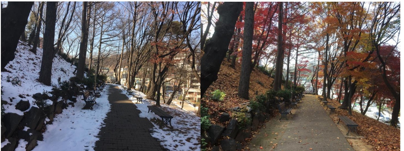
我在中央大度過了秋冬，我覺得非常的幸運，因為真的很美。圖中是我最喜歡在學校思考的長椅公園。