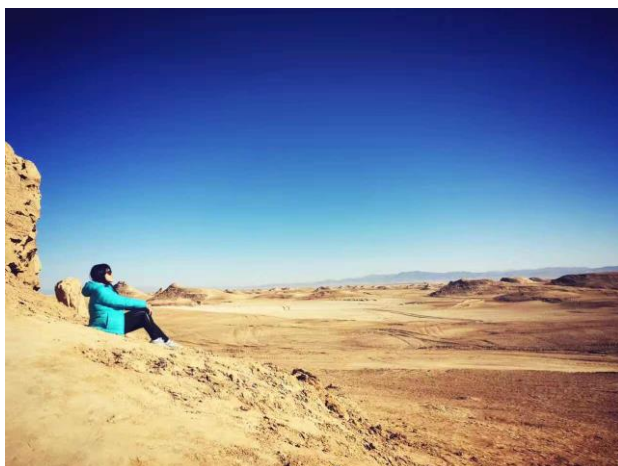
西北絲路之旅—雅丹魔鬼城