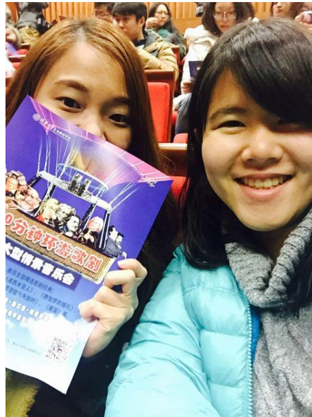
新清華學堂歌劇表演