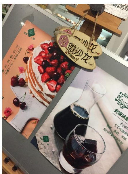
清華咖啡館—安家小廚